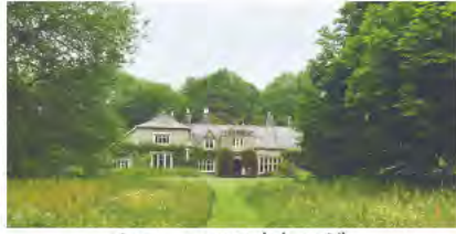
シューマツハカレッジ

想が、起床、説明、6時半、眠る。1日、説明、6時半、眠る。1日、説明、6時半、眠る。