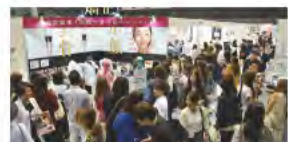
*写真は前回の会場の様子です。

主催・お問合せ先 (株)ビジネスガイド社 福岡国際ビューティー・ショー事務局 〒111-0034 東京都台東区雷門2-6-2ぎふとビル TEL: 03-3843-9901 FAX: 03-3847-9436