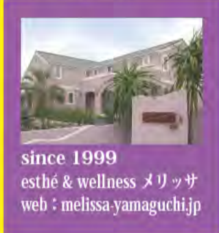
since 1999 esthé & wellness メリッサ web : melissa.yamaguchi.jp

プロフィール 株式会社 Melissa 代表取締役 株式会社 MEROW 臨床心理士/リフレッシングセラピスト タロットセラピスト 1999年エステティックサロン メリッサ 設立。2011年美容機器卸売会社・メンタルヘルス事業社 MEROW 設立。 心理学系大学院卒。“メンタルヘルスにおけるエステティックの有用性”を研究。延会員数6500名以上を持つエステティックサロンを運営する傍ら、カウンセリングをはじめメンタルヘルス事業にも従事。エステティックと心理学との融合を目的とした事業展開を拡大中。